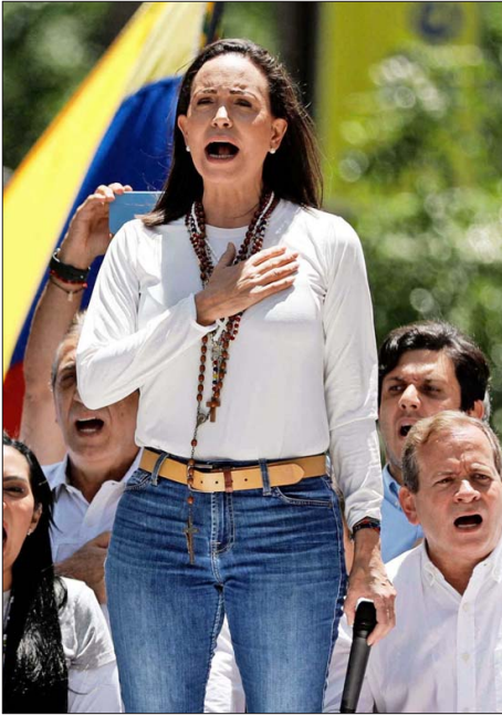
MACHADO dijo que quienes participen serán cómplices de Maduro.

Por su decisión de competir, el exgobernador del estado de Miranda fue expulsado del partido de toda su vida, Primero