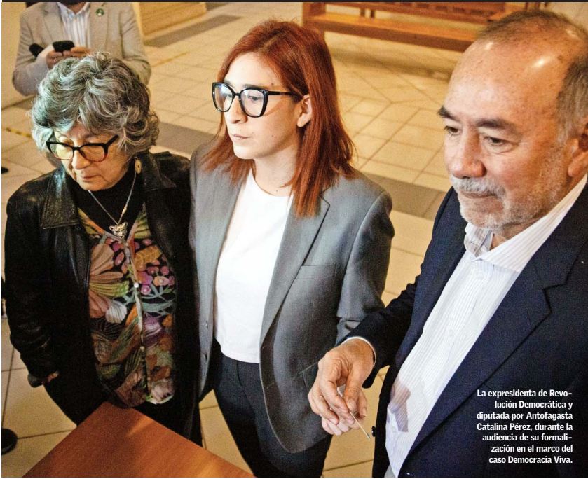
La expresidenta de Revolución Democrática y diputada por Antofagasta Catalina Pérez, durante la audiencia de su formalización en el marco del caso Democracia Viva.

EN ARRESTO DOMICILIARIO POR CASO QUE INICIÓ LA CRISIS DEL FA: