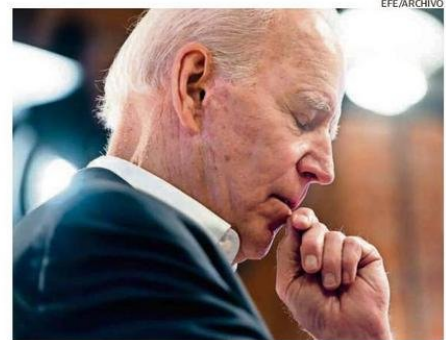
BIDEN TIENE 82 AÑOS Y GOBERNÓ EE.UU. ENTRE 2021 Y 2025.