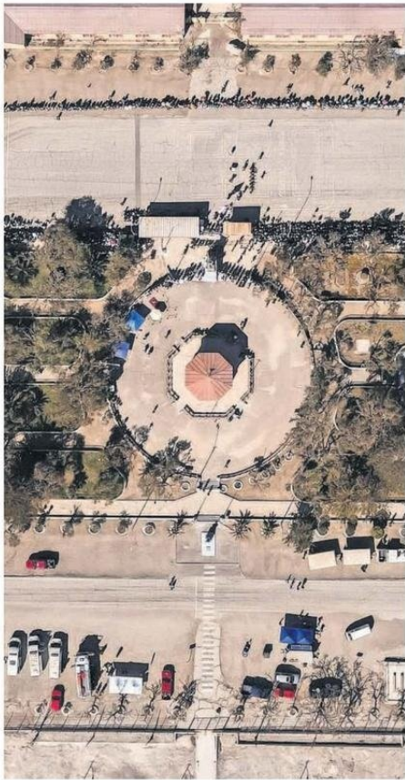
ESTA TIERRA ES UNA TIERRA MUY BENDECIDA.