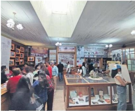
CADA RIÑÓN TIENE UN HISTORIA DE CONTAR.