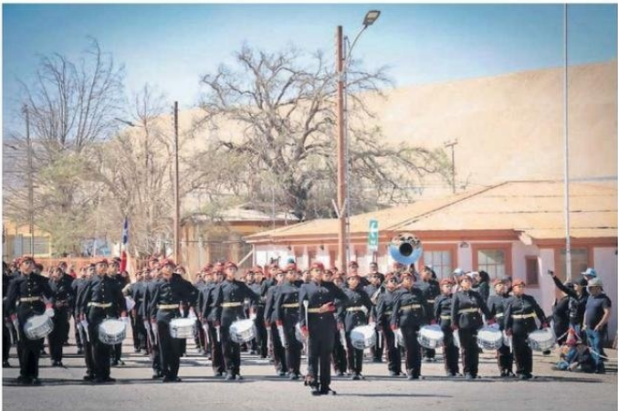
EL TRADICIONAL DESFILE CÍVICO-MILITAR REUNIÓ A CIENTOS DE FAMILIAS CHUQUICAMATINAS.

D urante más de un siglo, miles de historias han nacido en Chuquicamata, una tierra bendecida en medio del desierto y muy generosa. El campamento minero está cumpliendo 110 años y lo está celebrando en grande. “Esperando el 18” puso la fiesta y el desfile cívico-militar, junto a las visitas guiadas, la nostalgia de los chuquicamatinos. 🇨🇱