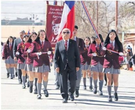
RESPECTO Y ADMIRACIÓN POR CHUQUICAMATA.