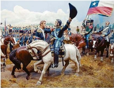
EL ABRAZO DE MAIPÚ, EN ESTACIÓN DEL METRO PLAZA DE MAIPÚ.

Desde aldeas precolombinas y Puelo de Valdivia en el cerro Huecón, hasta la batalla de Rancagua y el abrazo de Maipú, pasando por el alto horno de la CAP, los pampinos del caliche, el ambiente de una escuela rural del sur y el paseo peatonal Barros Arana de Concepción tienen su lugar en la producción del artista, que abrirá su taller el