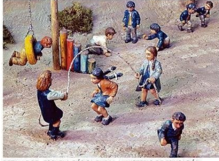
DETALLE DE ESCUELA BÁSICA RURAL. MINISTERIO DE EDUCACIÓN.