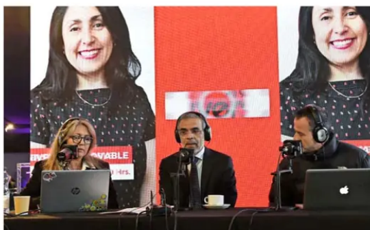
Gran parte de la programación de Radio Universo se realizó en los jardines de El Mercurio, dando así una completa cobertura al Cybertech & Technology South America 2025.