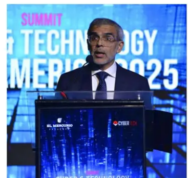
Luis Cordero, ministro de Seguridad Pública.