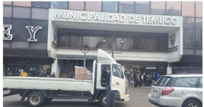
LAS 13 ENTIDADES CON MAYOR CANTIDAD DE LICENCIAS MÉDICAS EVENTUALMENTE IRREGULARES DEBIDO A QUE SUS TITULARES HABRÍAN SALIDO DEL PAÍS DURANTE EL RESPECTIVO REPOSO

Y en lo referente al informe propiamente tal, la seremi Tapia informó que “se instruirán su-