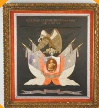
CUADRO DE PRAT ENTREGADO EN 1908 A CORBETA BAQUEDANO.

rra de paz" y es ahí donde descansan los espíritus de los guerreros japoneses. "No es un cementerio, pero están los kamis. Un kami es el espíritu de un guerrero que luego de su propósito de vida llegan a ese estado. Ahí están los nombres de las personas que lucharon por la grandeza de Japón".