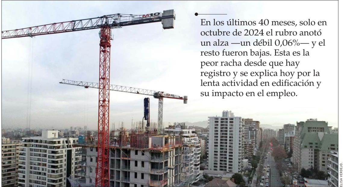
En el primer trimestre de 2025, se vendieron 4.897 viviendas nuevas en la Región Metropolitana, cifra 23% rezagada respecto del promedio histórico, según datos de la CChC.

Por otra parte, León comentó que la inversión minera “ha registrado un desempeño relativo-