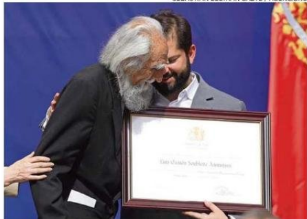
En 2023 recibió el Premio Nacional de Humanidades.

PENSAMIENTO Y LEGADO Hasta sus últimos días fue profesor emérito de la Uni-