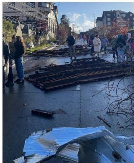
CALLE DEL SALVADOR UNA DE LAS MÁS AFECTADAS.