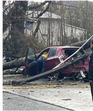
ARBOLES CAYERON SOBRE AUTOMÓVILES.

se vieron interrumpidas en el tránsito durante la jornada de ayer debido a la caída de árboles y postes del tendido eléctrico.