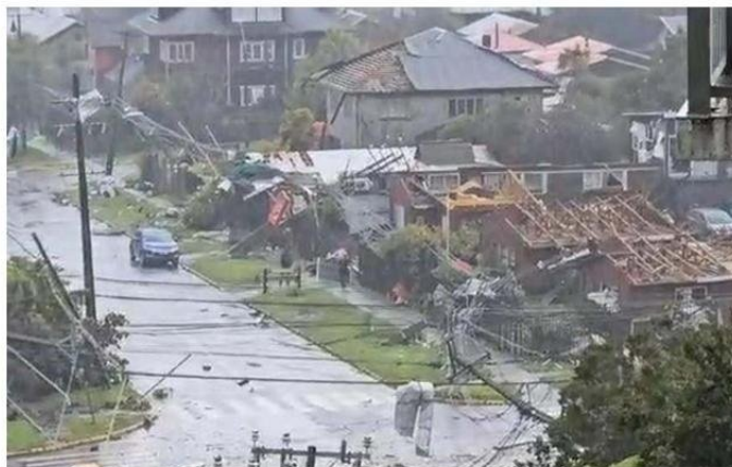
VARIOS SECTORES RESIDENCIALES SE VIERON MUY AFECTADOS CON CUANTIOSOS DAÑOS.

PUERTO VARAS. Fenómeno ocurrió a las 15:15 horas, en categoría F1, con viento entre 135 y 170 kilómetros por hora. Desprendió el techo de 100 viviendas y afectó edificios, botó árboles y postes del tendido eléctrico. La comuna fue declarada en Alerta Roja y hoy se suspendieron las clases.