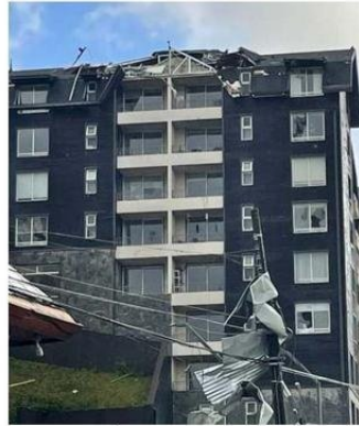
EDIFICIOS Y VEHÍCULOS FUERON DAÑADOS.

habría llegado la velocidad máxima del viento en el tornado de la tarde ayer.