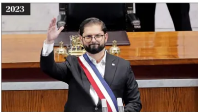
2023 El Presidente Boric extendió su discurso por tres horas y 36 minutos, y condicionó su hoja de ruta a la aprobación de la reforma tributaria.