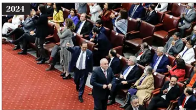
2024 Diputados de oposición salieron del salón tras el anuncio del proyecto de aborto. El discurso estuvo marcado por seguridad y crecimiento económico.