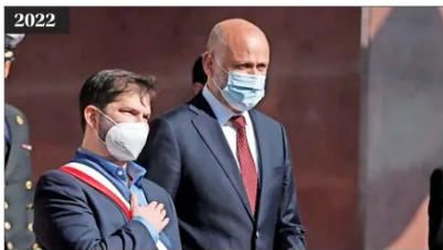
2022 Aun con medidas sanitarias vigentes, el mandatario desplegó su programa original de gobierno con el Estado como protagonista.