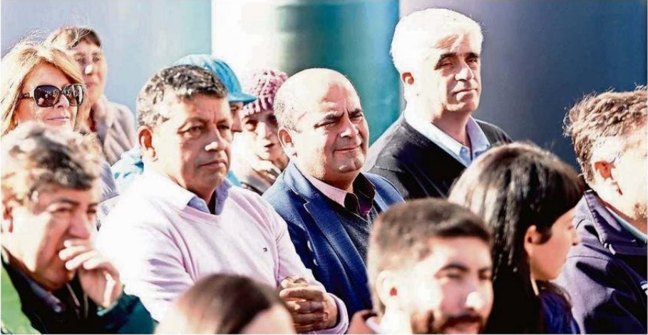
LA COOPERATIVA ESPERA ESCALAR EN COMPETITIVIDAD, INNOVACIÓN Y PRESENCIA EN NUEVOS MERCADOS.