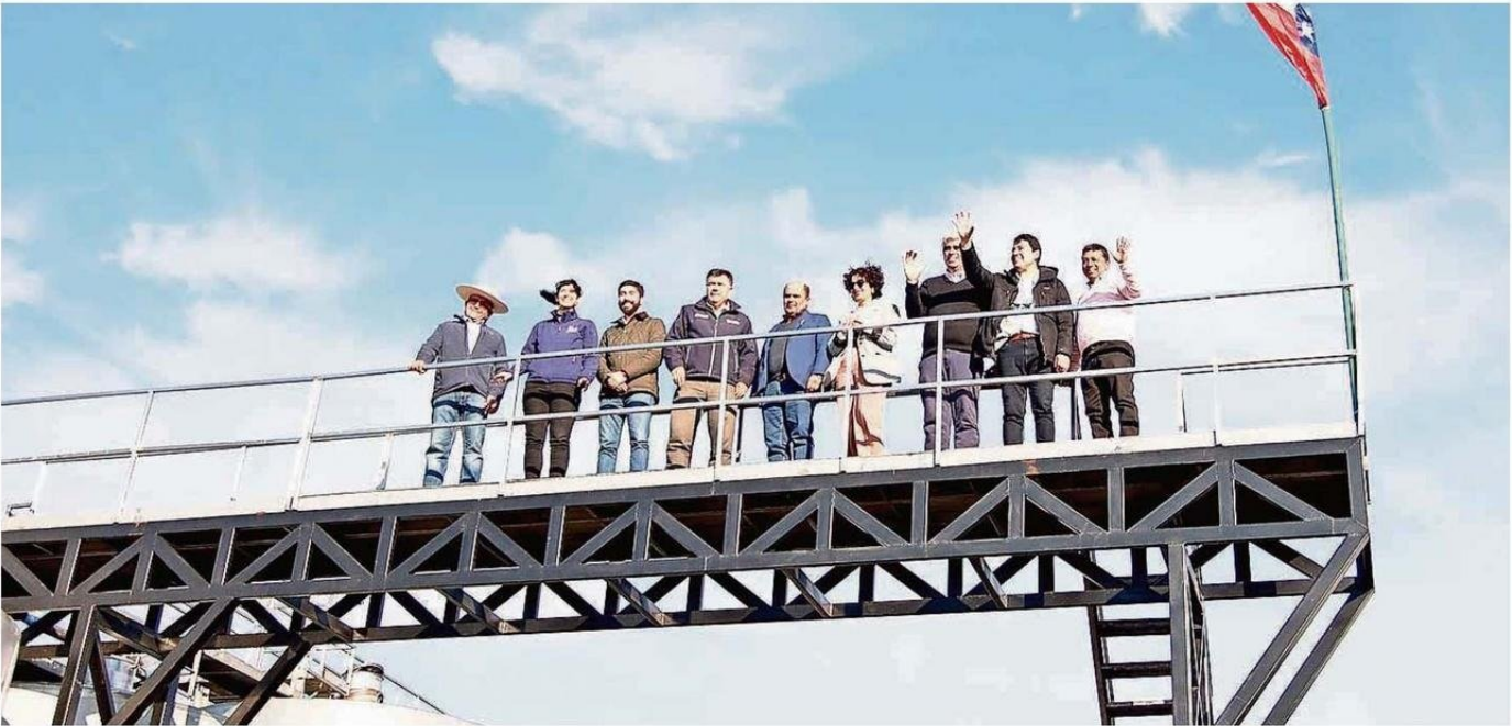
EL ALCALDE DE QUILLÓN, FELIPE CATALÁN VENEGAS, DESTACÓ EL IMPACTO DE ESTA ALIANZA PARA LA COMUNA.