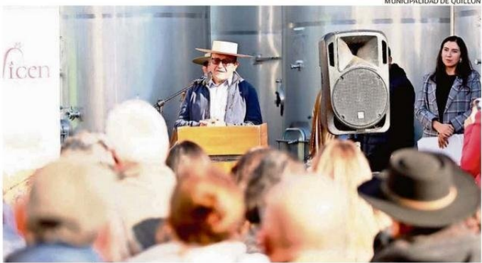
LA ACTIVIDAD MARCÓ EL CIERRE DE UN CICLO PRODUCTIVO.

Con la presencia del ministro de Agricultura, Esteban Valenzuela, la Cooperativa Agrícola y Vitivinícola Cerro Negro (COOVICEN) cerró su temporada de vendimias con un importante hito: la firma de una Alianza Productiva junto a INDAP Ñuble. Este acuerdo tiene como objetivo modernizar los viñedos de la cooperativa y avanzar hacia una producción vitivinícola con estándares de exportación. Durante la jornada, también se inauguraron las mejoras realizadas en el Centro de Acopio y Vinificación de COOVICEN, financiadas a través del Programa de Desarrollo de Inversiones (PDI) de INDAP.