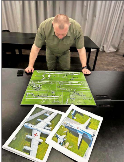
EL JEFE del Servicio de Seguridad de Ucrania, Vasyl Malyuk, mira un mapa que muestra una base aérea militar rusa.

El Ministerio de Defensa ruso afirmó que drones ucranianos atacaron aeródromos en cinco regiones y que varios aviones fueron incendiados.