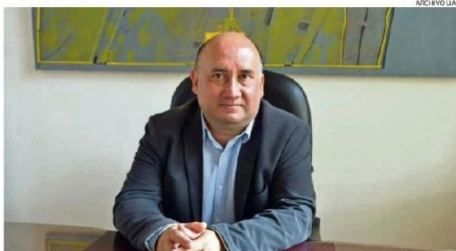
JOSÉ DÖRNER ES EL ACTUAL RECTOR DE LA UNIVERSIDAD AUSTRAL DE CHILE. BUSCA CONTINUAR SU LABOR.