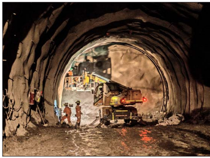
El resultado del Imacec de abril estuvo incidido por el crecimiento del 10,7% que registró la minería, ante una mayor extracción de cobre.

El resultado del Imacec de abril estuvo incidido por el cre-