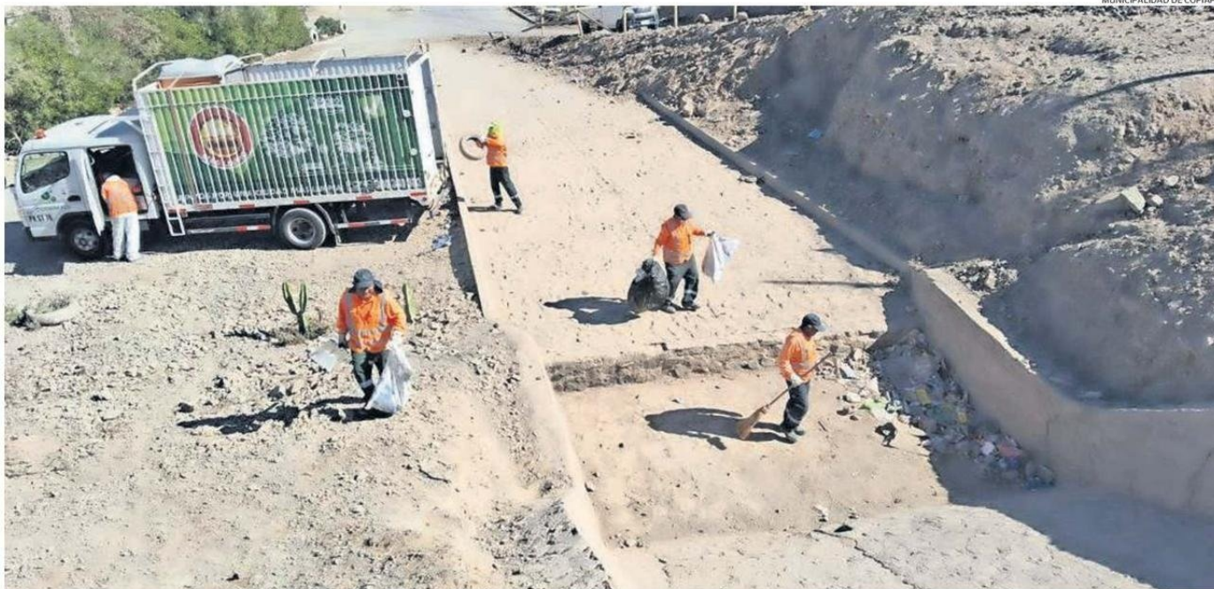
ALGUNOS DE LOS OPERATIVOS DE LIMPIEZA QUE SE HAN REALIZADO LOS ÚLTIMOS AÑOS EN LAS PISCINAS DECANTADORAS DE COPIAPO.