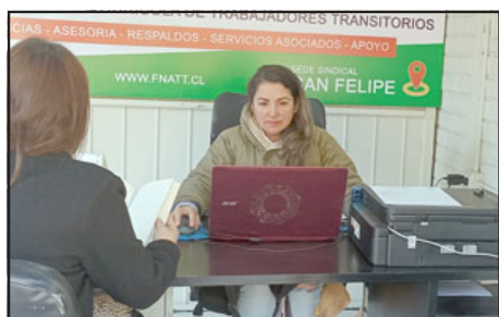
La oficina de San Felipe con su secretaria atendiendo consultas.

Hasta el momento no hay socios en San Felipe. «Habíamos hecho dos sindicatos en San Felipe anteriormente, pero hubo discusiones internas entre los muchachos. La verdad de las cosas, que la mayoría que llega a los sindicatos llegan buscando recursos, dineros, tienen una idea equivocada del mismo. Es como, 'ya, soy jefe del sindicato, ¿dónde está la plata?' y no es así, esto es una lucha. Nosotros estamos creando algo en el sector agrícola, algo que no existía nunca», concluyó.