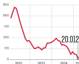
Creación de empleo En número anual