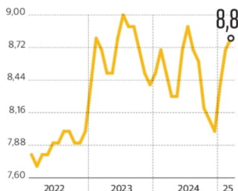
Tasa de desempleo En %