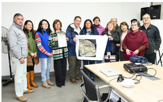
EL ALCALDE JAIME VELOSO celebró la concreción del terreno junto a vecinos y el Comité de Apoyo al Fuerte.

La iniciativa busca transformar el sitio en un referente turístico y cultural que fortalezca la identidad comunal, rescatando la memoria histórica de uno de los períodos más significativos de la región.