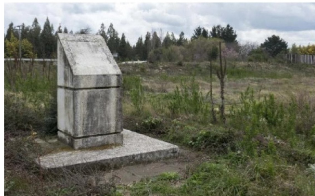
EL PROYECTO DE RECUPERACIÓN busca rescatar la memoria histórica de la Conquista y la Colonia en la provincia.

"Nos vamos muy contentos de haber logrado la