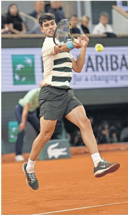
EL CAMPEÓN VIGENTE TIENE SUPREMACÍA SOBRE EL RETADOR.

Alcaraz, que había derrotado al italiano en los dos choques anteriores es-