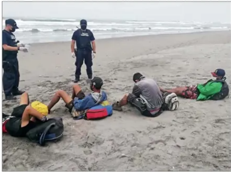
Más de la mitad de los pasos no habilitados a nivel país identificados por Carabineros se contabiliza en regiones del norte del país. Expertos plantean que estos representan solo una parte de las múltiples rutas ilegales.