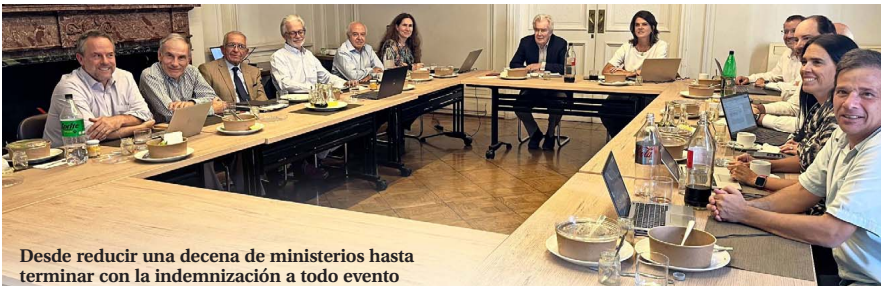
Desde reducir una decena de ministerios hasta terminar con la indemnización a todo evento

“Lo anterior debe ser complementado con una mayor eficiencia del gasto público, de manera de tender a un superávit prima-