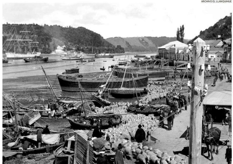
ANGELMÓ EN 1945, UNA IMAGEN DISTINTA DE LA CALETA QUE CONOCEMOS HOY, CUANDO CAUTIVABA A PINTORES CON SUS LANCHAS Y COMERCIO.

En 1956 se trasladó a España y expuso en la Galería Feniz y la Sala Dardo de Madrid, además en la ciudad de Bilbao. Ese mismo año fue nombrado agregado cultural de la Embajada de Chile en Gran Bretaña. Una de sus mayores giras la