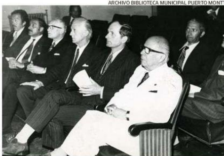
EN 1975, EL PINTOR FUE DECLARADO HIJO ILUSTRE DE PUERTO MONTT.

1978 el miércoles 27 de diciembre fue internado en el Hospital de Carabineros. Murió tres días después.