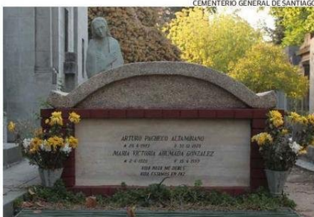
SU TUMBA EN EL MAUSOLEO FAMILIAR DEL CEMENTERIO GENERAL.