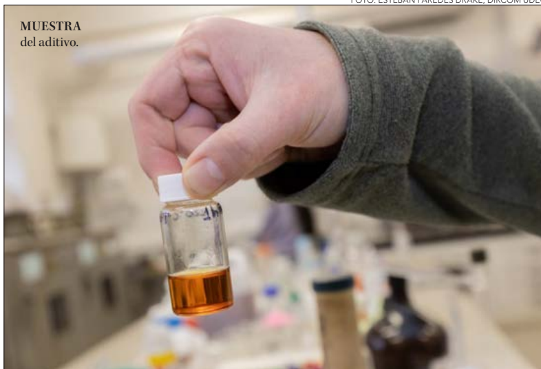
MUESTRA del aditivo.

El propósito de la investigación es producir un aditivo de factura verde como opción a los existentes, contribuir a la reducción de la huella de carbono en la industria papelera y ofrecer oportunidades de negocio a los recicladores.