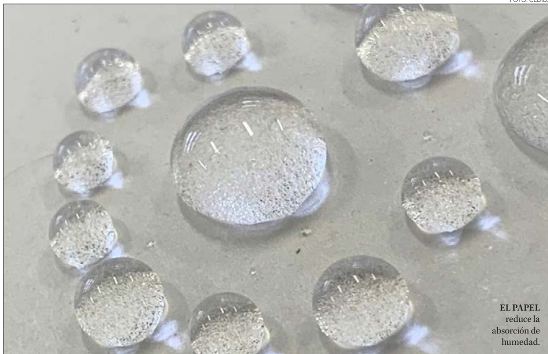
EL PAPEL reduce la absorción de humedad.

El producto que ensayan los investigadores del Laboratorio de Productos Forestales tiene como componentes centrales los aceites de fritura -que son producidos a partir de semillas- y un tipo especial de molécula, de origen vegetal, que se obtiene por fermentación y que es importada para este estudio. “Todas las materias primas de nuestro encolante provienen de fuentes renovables”, asevera el especialista en materiales para reemplazo del plástico, señalando que de este modo se cumple con otro propósito del proyecto, que es contribuir a la reducción de la huella de carbono en la industria