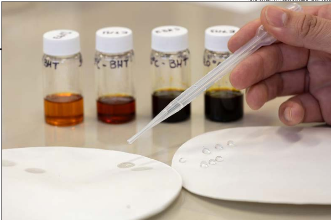
MUESTRAS de papel sin aditivo y con aditivo.