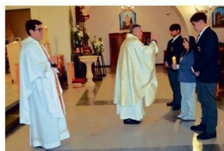
LA LUZ QUE REPRESENTA LA LLAMA VIVA DE LA FE DE LA COMUNIDAD EDUCATIVA DE LA EISA.