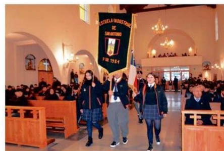
SE PRESENTÓ EL ESTANDARTE JUNTO A LA BANDERA CHILENA COMO SIGNO DE INSTITUCIONALIDAD.