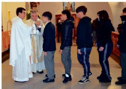
DURANTE EL RITO DE LA COMUNIÓN.