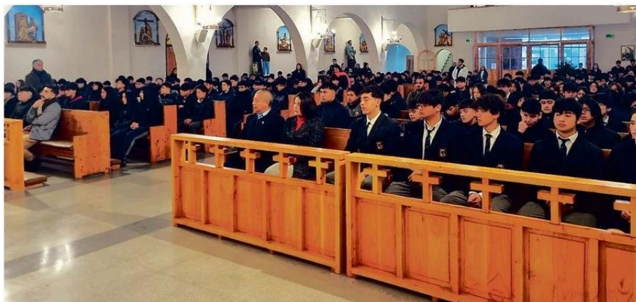
LA COMUNIDAD EDUCATIVAS DE LA EISA DURANTE LA MISA.