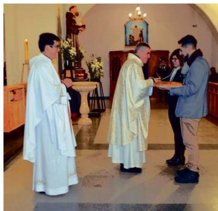
DURANTE LA ENTREGA DE OFRENDAS.