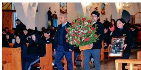
SE OFRENDÓ UN ARREGLO FLORAL QUE FUE DEPOSITADO A LOS PIES DEL SAGRADO CORAZÓN DE JESÚS.