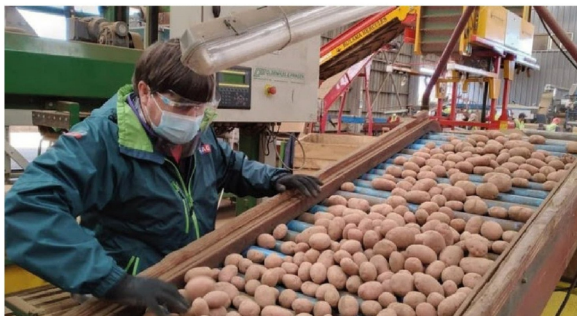
PARA FORMAR UNA INDUSTRIA procesadora de papa en Chile, los productores piden mejores instrumentos financieros y bancarios.

Respecto de este punto, Miquel agregó que "todavía podríamos sacarle muchísimo