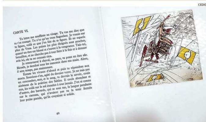
LA EXPOSICIÓN CONTEMPLA TAMBIÉN TALLERES ESPECIALES, ABIERTOS A LA COMUNIDAD.