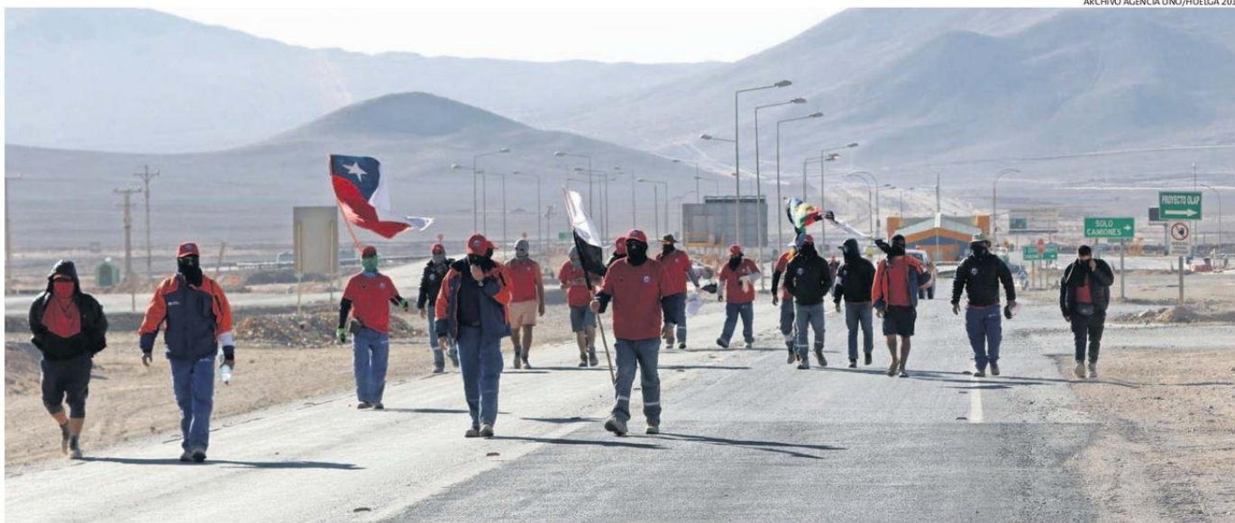
EN LA FOTOGRAFÍA LO QUE FUE LA HUELGA LEGAL DE TRABAJADORES DE MINERA ESCONDIDA EN EL 2017. SITUACIONES EN ESE PROCESO GATILLARON EN LO QUE AYER FALLO EL TRIBUNAL LABORAL.