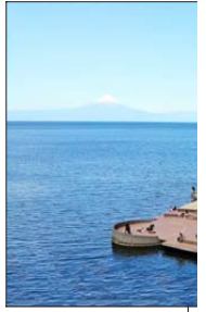
El Teatro del Lago será el telón de fondo del encuentro.

"El siguiente paso es la corrección atmosférica (nivel 2), lo que permitirá calcular reflectancia de superficie y aumentar aún más el valor ecológico de los datos. Con esto, Lemu Nge no solo observa el estado actual de los ecosistemas, sino que permite monitorear su evolución a lo largo del tiempo", añade.