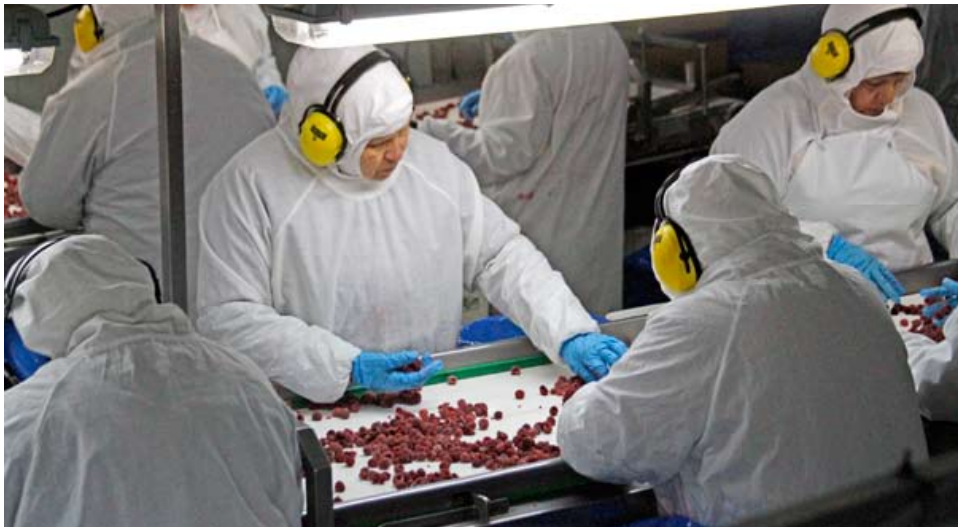
Las frutas procesadas (congeladas) acumulan envíos por US$ 86,3 millones, con un alza de 38,2% respecto a 2024.

Totalizan US$ 571,7 millones. Aumento respecto a 2024 se explica por el buen desempeño de los sectores forestal y agrícola, principalmente de los rubros de maderas elaboradas y frutas congeladas.