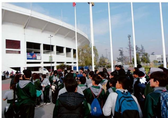
EL ESTADIO NACIONAL LLAMÓ LA ATENCIÓN DE LOS ESTUDIANTES POR SU GRAN INFRAESTRUCTURA.

que los estudiantes internalicen conceptos que en el aula son más abstractos, haciendo el aprendizaje más significativo y duradero", señaló.