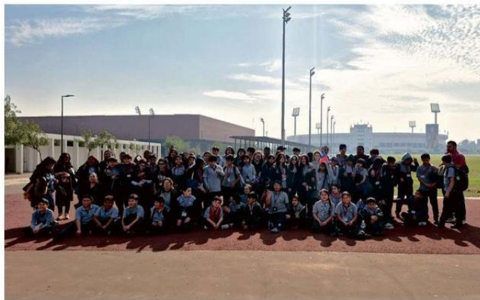
LOS ALUMNOS DEL SEGUNDO CICLO RECORRIERON EL ESTADIO NACIONAL.

clusión, el respeto y el trabajo en equipo, fundamentales para la formación integral de los estudiantes.