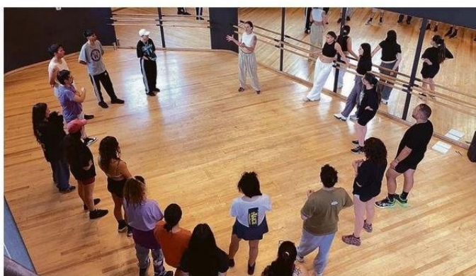
RECONOCIDOS EXPONENTES DE ESTE ARTE OFRECERÁN CLASES DURANTE LA MAÑANA.

Esta intervención multidisciplinar tendrá por objetivo además visibilizar y poner en valor las expresiones culturales afro presentes en el territorio chileno, generando instancias de exploración y aprendizaje desde una perspectiva sensible, lúdica y participativa, según explican desde el Centex.