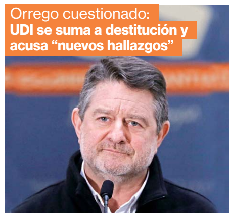
Orrego cuestionado: UDI se suma a destitución y acusa "nuevos hallazgos"