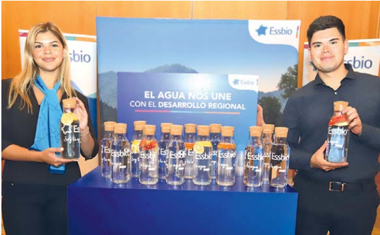
Stand de la sanitaria ESSBIO.