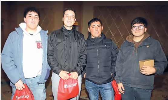
Estudiantes de INACAP Sede Rancagua.