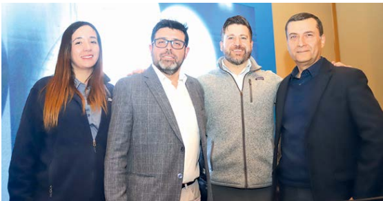
Stand de la empresa ME Elecmetal y sus encargados durante este evento.