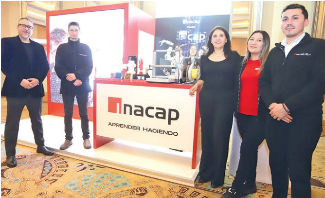
Punto de encuentro de INACAP en ENEO 2025.