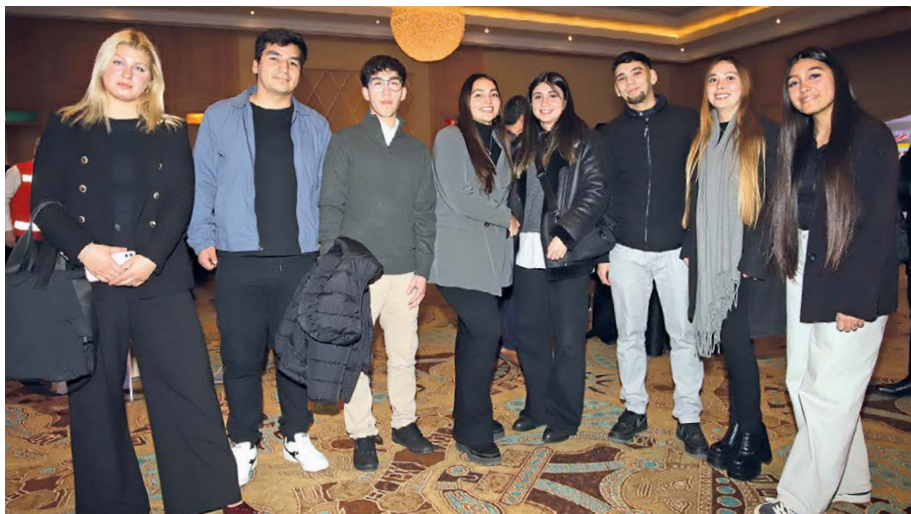
Estudiantes de INACAP Sede Rancagua.