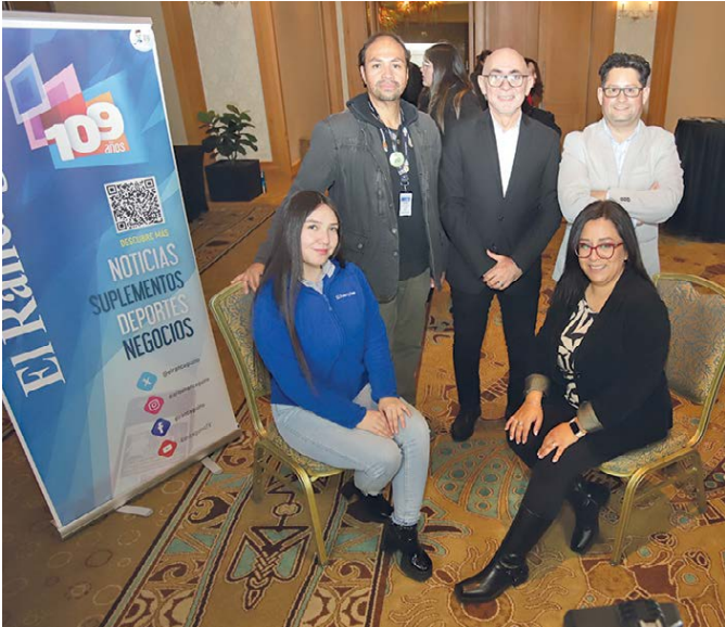
Parte del equipo de El Rancagüino encargado de la cobertura de ENEO 2025 desde Monticello.