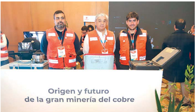
Espacio en que Codelco División El Teniente demostró a los asistentes a ENEO por qué es la gran compañía del cobre en Chile.