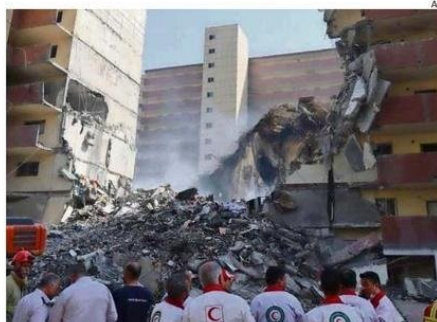
ISRAEL CALIFICÓ COMO EXITOSA LA INCURSIÓN SOBRE IRÁN.

Los bombardeos israelíes golpearon varios puntos del país persa, entre ellos la capital Teherán y una planta nuclear en Natanz, y han dejado varias víctimas fatales. Al respecto, el ministro de Relaciones Exteriores iraní, Abás Araquí defendió el