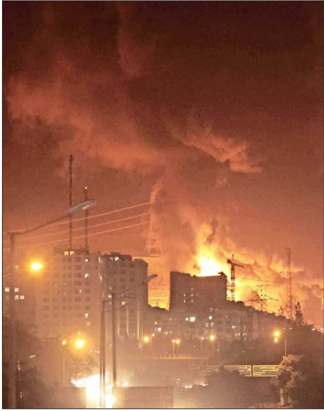
UN ATAQUE provocó un incendio en un depósito de combustible en Teherán.

El Primer Ministro israelí, Benjamin Netanyahu, también hizo ayer un balance positivo sobre las operaciones en curso para “eliminar una doble amenaza contra el Estado de Israel”: la producción de armas nucleares y de misiles balísticos de Irán. Según dijo, ya le dieron “un duro golpe al principal centro de investigación nuclear”, lo que “podría retrasarlos durante muchos años” en su presunto intento de conseguir la bomba