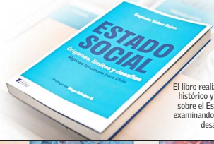
El libro realiza un análisis histórico y conceptual sobre el Estado Social, examinando sus límites y desafíos.