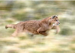
ESTADO. Fuera del parque, el puma aún enfrenta la amenaza de la cacería.

“ R ealmente no sé quién la vio primero, pero todos coinciden en que los primeros avistamientos de ella fueron alrededor de 2016. Algunos dicen que la vieron un poco antes, otros después, pe-