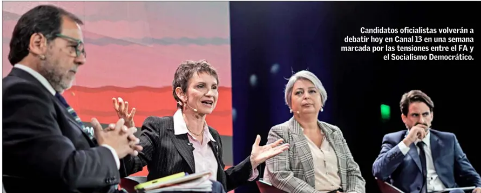
Candidatos oficialistas volverán a debatir hoy en Canal 13 en una semana marcada por las tensiones entre el FA y el Socialismo Democrático.

Ese mismo escenario, que para el oficialismo es desfavorable,