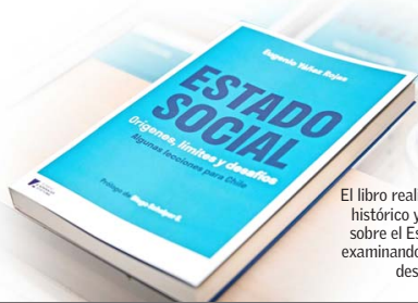
El libro realiza un análisis histórico y conceptual sobre el Estado Social, examinando sus límites y desafíos.