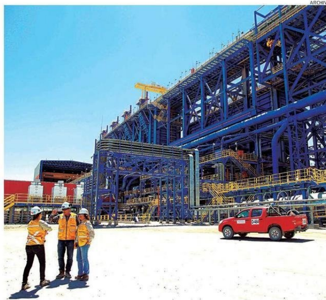
LA REGIÓN LIDERA LAS INVERSIONES MINERAS EN CHILE, CONCENTRANDO UN 38% DE LA CARTERA MINERA DEL PAÍS.

● En el caso de las iniciativas mineras, se encuentra el proyecto de Antofagasta Minerals, Nueva Centinela, la cual apunta a aumentar la producción de cobre y extender la vida útil de la faena en 30 años más. Esta iniciativa de Sierra Gorda ostenta la mayor inversión por lejos en todo Chile, con US$4.400 millones. Apuntando además a funcionar completamente con energía renovable, Nueva Centinela se encuentra actualmente en construcción y se estima que las obras terminarían durante el 2027.