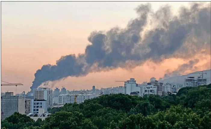
UNO DE LOS ATAQUES israelíes de ayer tuvo como objetivo la sede central de la radiotelevisión pública iraní (IRIB) en Teherán. El bombardeo se produjo mientras la estación estaba transmitiendo en vivo.

“Irán debería haber firmado el acuerdo que les dije. Que lástima (...) Todos deberían evacuar Teherán inmediatamente!”