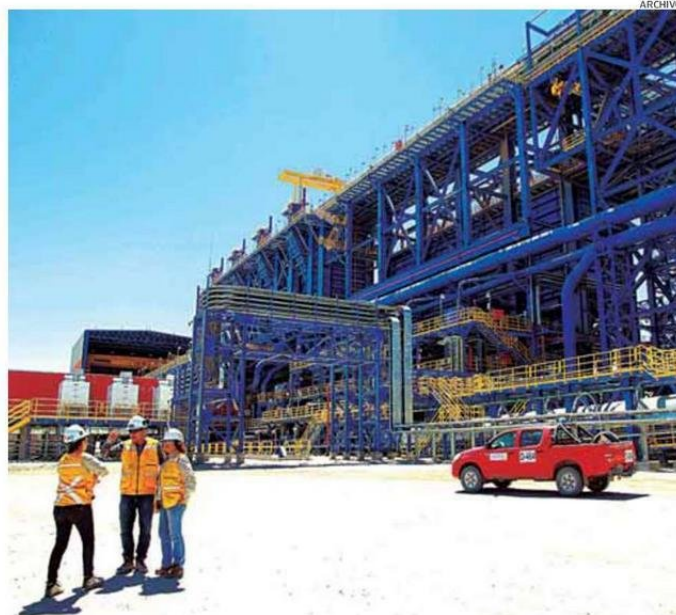
LA REGIÓN LIDERA LAS INVERSIONES MINERAS EN CHILE, CONCENTRANDO UN 38% DE LA CARTERA MINERA DEL PAÍS.

● En el caso de las iniciativas mineras, se encuentra el proyecto de Antofagasta Minerals, Nueva Centinela, la cual apunta a aumentar la producción de cobre y extender la vida útil de la faena en 30 años más. Esta iniciativa de Sierra Gorda ostenta la mayor inversión por lejos en todo Chile, con US$4.400 millones. Apuntando además a funcionar completamente con energía renovable, Nueva Centinela se encuentra actualmente en construcción y se estima que las obras terminarían durante el 2027.