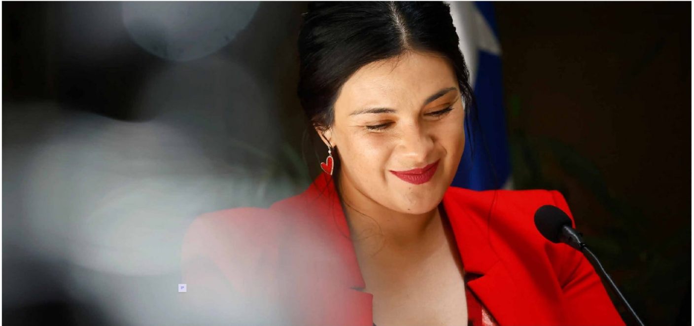
► Karol Cariola fue presidenta de la Cámara de Diputados hasta el 17 de marzo de 2025.