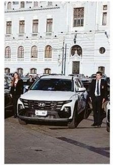
MÓVILES PARA REFORZAR LABOR.