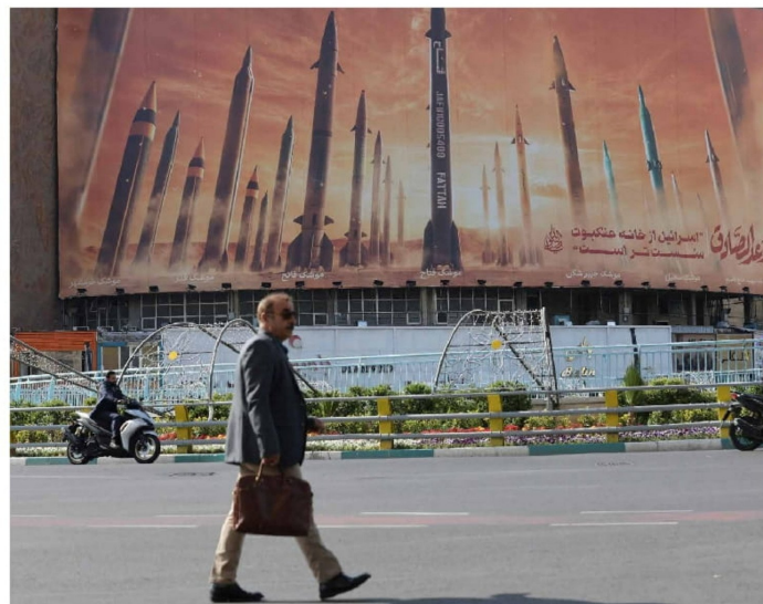
► Un cartel antiisraelí con una imagen de misiles iraníes se ve en una calle de Teherán, Irán.

Poco después de que se escucharan explosiones en Doha, capital de Qatar, el ejército iraní anunció el lanzamiento de la Operación Bendiciones de la Victoria. Los medios iraníes informaron simultáneamente que bases estadounidenses en Irak también fueron blanco del ataque. Los sistemas de defensa aérea fueron ac-