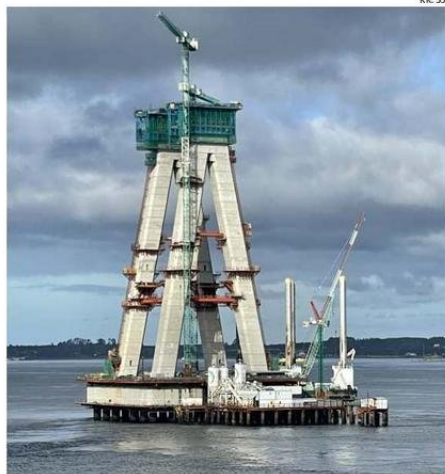
EL PUENTE EN EL CANAL DE CHACAO ES UNA DE LAS GRANDE OBRAS.

Resaltó que ese dinamismo "está en plena sintonía con la estrategia procrecimiento y empleo que ha im-