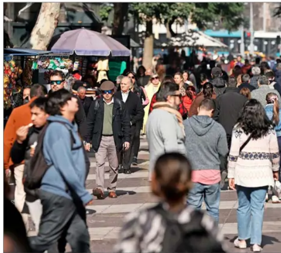
La tasa de desempleo, durante el trimestre febrero-abril de 2025, se ubicó en un 8,8% y, según los expertos, no hay señales de una recuperación de la ocupación.

“Los incrementos del costo salarial por hora, desalineados con el crecimiento de la productividad laboral, especialmente, cuando son persistentes, pueden generar efectos negativos sobre la generación de puestos de trabajo formales”.