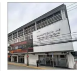
La obra comenzó en 2021, pero se detuvo a los pocos meses debido a hallazgos arqueológicos.

EL CONTEXTO DE LA DISCUSIÓN SOBRE EL DOMICILIO POLÍTICO DE LA EXMINISTRA | C 2